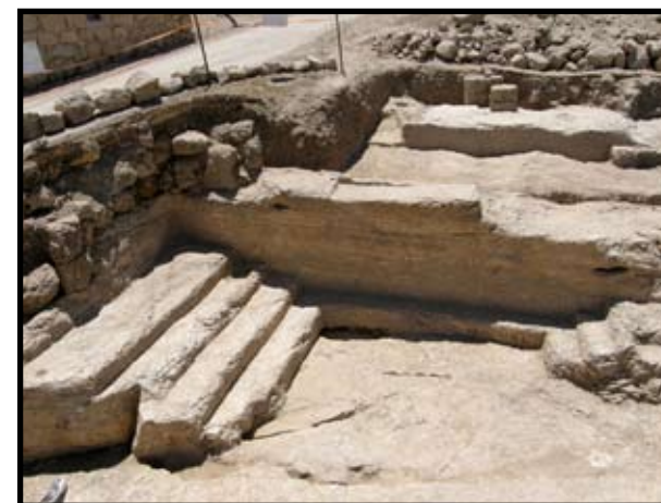
איור 5: שטח A: הספסלים החצובים באולם הדרומי (בית הכנסת)

הספסל התחתון במערך המושבים משתרע לאורך שלוש דופנות המבנה ששרדו, ויוצר את צורת האותח. מעליו בדופנות האורך של המבנה נחצבו ספסלים מדורגים היוצרים צמד טריבונות. לאורך הדופן הדרומית נחצבו ארבעה ספסלים מדורגים; רוחבם 0.50 מ' וגובהם 0.30 מ'. רוחב השלח של הספסל העליון ביותר מגיע ל-1.10 מ'. בדופן הצפונית נקבעו שלושה ספסלים (0.40 מ' רוחב).