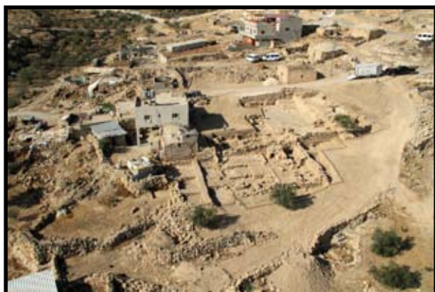
איור 3: שטח A: מראה כללי בתום החפירה, מבט מצפון

המכלול מורכב משלושה אגפים: מערבי (יחידה I), מזרחי (יחידה II) וצפוני (יחידה III), שנבנו במספר שלבים. המכלול עושה שימוש במערך חציבות ושרידים קדומים מימי בית שני כפי הנראה. בתקופה המוסלמית הקדומה משתנים המבנה ושימושו.