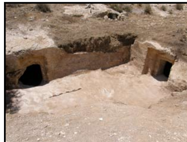
איור 10: שטח G: מתחם מערות קבורה

בשטח נחפר מתחם של מערות כוכים האופייניות לימי בית שני ושימשו לקבורה. בסך הכול נתגלו שלוש מערות החצובות זו לצד זו בתוך מתחם קבורה אחד החצוב בסלע בצדו המערבי של האתר, במעלה המדרון של נ"ג 805. למערות פתח כניסה מדורג החצוב כמסגרת מרובעת שבתוכה קבוע הפתח למערה. מן הכניסה יורדים לחדר הקבורה