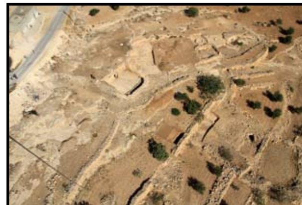
איור 8: מראה כללי של שטחים D ו-F

בחזית המערה חצר חצובה רחבת ידיים (8X8 מ') מסותתת למשעי. מהחצר ישנו מעבר דרך פתח חצוב אל אולם רבוע (4X4 מ') המשמש כבור עמידה רדוד ורחב ידיים. מסביב לבור העמידה ערוכים בכל אחת מפאות הבור שלושה חדרים (3X2.5 מ') המשמשים כחדרי קבורה. במרכזו של כל אחד מהחדרים נחצב בור עמידה רדוד וסביבו שלוש אצטבאות. דומה כי יש לשייך מערות אלה לתקופה הרומית המאוחרת וזאת על סמך תוכניתם. חסרונם של כוכים מלמד כי יש לאחר, ככל הנראה, מערות אלה למאות השנייה השלישית. מערות קבורה