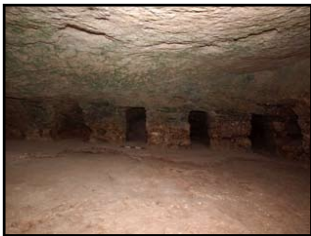
איור 9: שטח E: מערת הקבורה הצפונית חדר הקבורה ומערכת הכוכים

צמד מערות קבורה החצובות זו ליד זו בתוך מתחם קבורה חצוב בסלע בצדו המערבי של האתר. למערות פתח כניסה מדורג החצוב כקשת שבתוכה קבוע הפתח למערה. חציבת המערה הדרומית לא הושלמה ואילו המערה הצפונית כוללת חדר קבורה מרכזי אשר סביבו חצובים כוכים. בחזית נמצאו עצמות אדם שהוצאו מהמערות במהלך שוד עתיקות. מערות קבורה מטיפוס זה אופייניות לימי הבית השני וייתכן שיש לשייכן לתקופה שבין המרידות במאה השנייה.