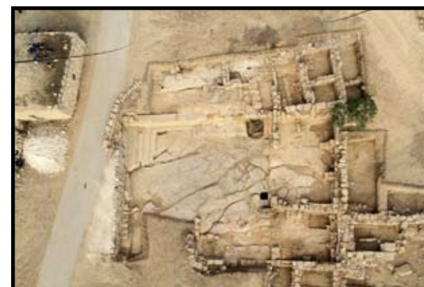
איור 4: שטח A: מראה כללי של האגף המערבי בתום החפירות ובו שרידי אולם הציבור (בית הכנסת), מבט ממזרח

עיקר השרידים בשטח שייכים, כאמור, למכלול בנייה רחב ידיים שגודלו כ-35X30 מ'. המבנה המתוארך לתקופה הביזנטית בנוי בחלקו אבני גזית ובחלקו חצוב בסלע. במכלול שלוש יחידות שנבנו כנראה בכמה שלבים. האגף המערבי (יחידה I) עושה שימוש בשרידים מימי הבית השני; האגף המזרחי (יחידה II) בנוי ממזרח לאגף המערבי; היחידה הצפונית (יחידה III) בנויה בצדו הצפון-מזרחי של המכלול, מצפון לאגף המזרחי.