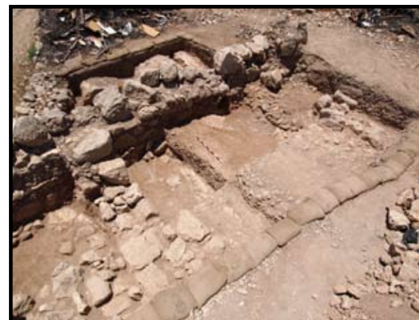
איור 7: שטח C: המבנה, מבט לדרום

בשטח זה נחשפו מערת קבורה מפוארת ולצדה מתחם תעשייתי, ובו שני אגני פריכה לזית ושרידי גת.