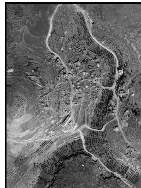
איור 1: תצלום אוויר: מפת איתור שטחי חפירה

המבנה מתייחד במערכת מושבים - ספסלים מדורגים החצובים בסלע וערוכים לאורך כותלי האולם. מן המערכת השתמרו חלק מהספסלים שלאורך הדופן הדרומית, הספסל שלאורך הדופן המערבית וקטע קטן מהמערך שלאורך הדופן הצפונית. הספסלים שבדופן המזרחית (אם היו כאלה) לא השתמרו כלל והוסרו בחציבה מאוחרת.